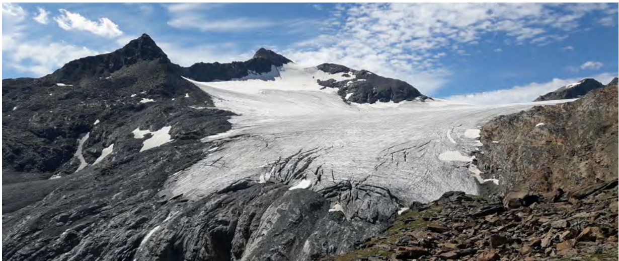
Abbildung 1: Kesselwandferner am 27.08.2020.

Die Geschwindigkeitsmessungen und Wartung des Pegelnetzes am Kesselwandferner wurden von 26-27. August 2020 durchgeführt. Dabei wurden alle Pegelpositionen sowie die Fließrichtungen als auch Höhenänderungen in den Querprofilen eingemessen. Alle Akkumulations- und Ablationspegel wurden an den Ausgangspositionen neu gebohrt und mit differentiellem GPS (DGPS) eingemessen. Die Basis für diese Messungen wurde wie in den Vorjahren unterhalb des Brandenburgerhauses (HP UBBH) sowie am Hauptpunkt unter Kesselschrofen (HP UKS) aufgestellt. Nach einer leichten Geschwindigkeitszunahme in den Jahren 2014 und 2015 (ca. 20m/a bei Pegel L9) aufgrund positiver Massenbilanzen beider Jahre, waren sowohl die Horizontal- als auch die Vertikalgeschwindigkeiten in den Folgejahren wieder rückläufig (aktuell ca. 14m/a am tiefstgelegenen und schnellsten Pegel L9).