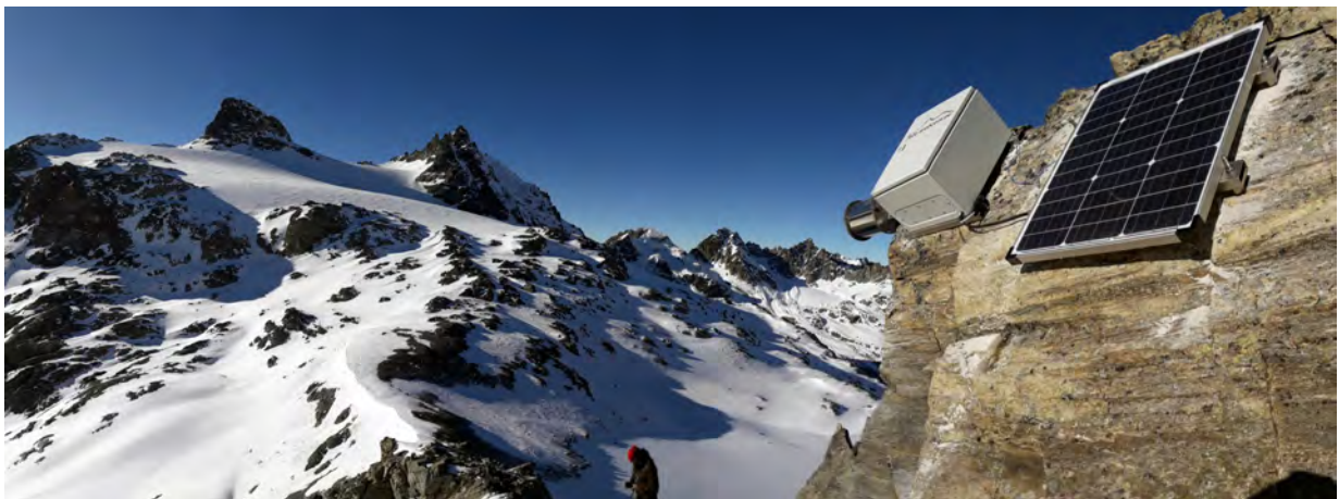
Abbildung 7: Neue Webcam am Urezzasjoch am 30.11.2020