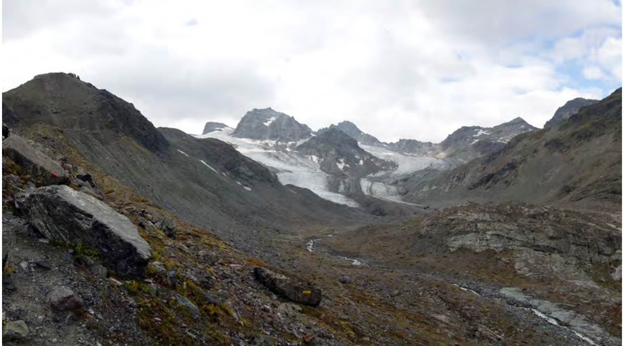
Abbildung 6: Jamtalferner am 17.09.2020