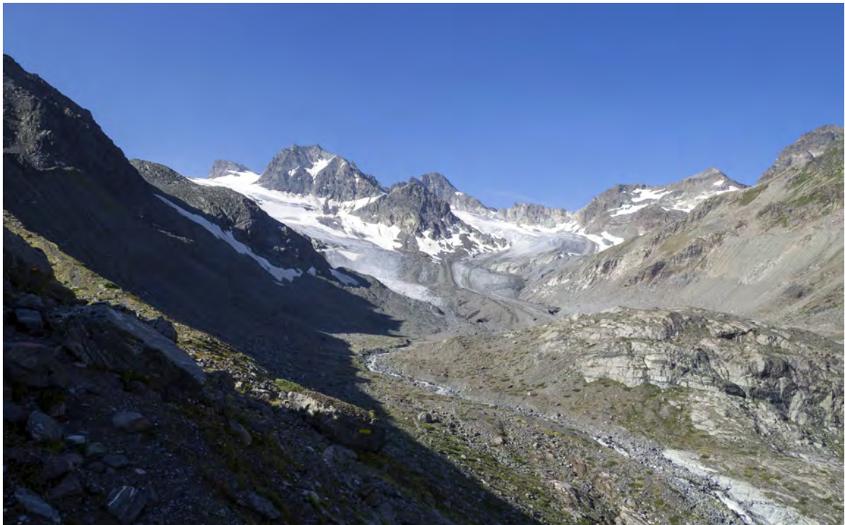
Abbildung 5: Jamtalferner am 11.08.2020

Am 30.11.2020 wurde am Urezzasjoch eine Webcam mit Blickrichtung Jamspitzen installiert: https://www.foto-webcam.eu/webcam/jamtalferner/