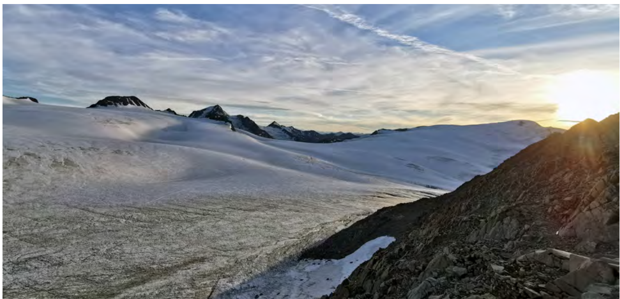
Abbildung 3: Blick vom Brandenburgerhaus Richtung Gepatschferner am 26.08.2020.